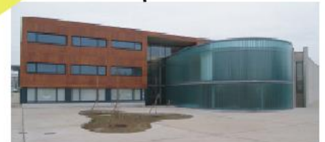
Ligne de bus n°6; arrêt Technopole